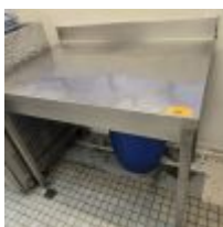
Table inox rectangulaire Mise à prix : 60€