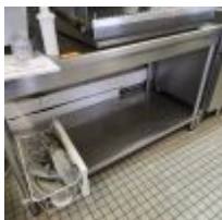
Table inox rectangulaire avec étagère en entrejambe Mise à prix : 60€

Pétrin triphasé, plaque illisible, sur roulettes Mise à prix : 200€